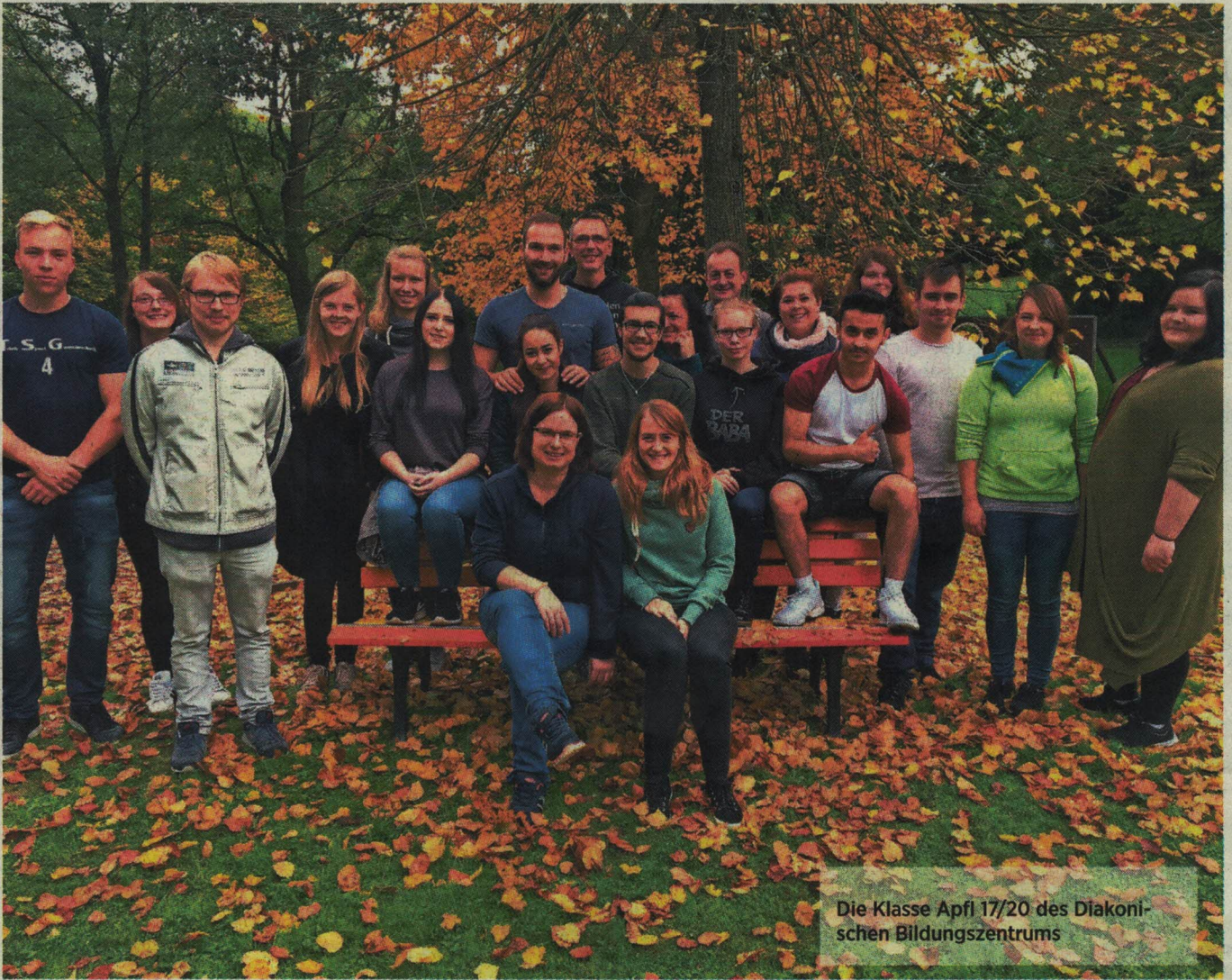
Die Klasse Apfl 17/20 des Diakonischen Bildungszentrums